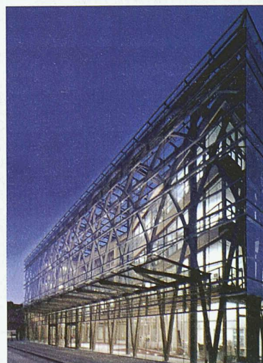
Neubau der Landesvertretung Nordrhein-Westfalen beim Bund in Berlin; Architektur: Petzinka Pink Architekten, Düsseldorf

linäre Zusammenarbeit haben zu zukunftsweisenden Baulösungen geführt, die an der Tagung anhand besonderer Beispiele vorgestellt werden. Die präsentierten Objekte zeichnen sich aus durch den konsequenten Einsatz leichter Materialien, die Flexibilität der Nutzflächen, ihre effizienten Energiekonzepte und durch eine offene, transparente Gestaltung. Die Tagung findet am 27. März (14.30–18.15 h) an der ETH Zürich im Hauptgebäude statt. Anmeldungen bis 14. März per Fax an 01 825 09 08 oder im Internet unter www.szs.ch (News/Veranstaltungskalender). Weitere Infos: Stahlbau-Zentrum Schweiz, Tel. 01 261 89 80.