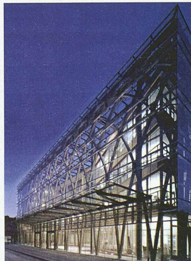
Neubau der Landesvertretung Nordrhein-Westfalen beim Bund in Berlin; Architektur: Petzinka Pink Architekten, Düsseldorf

Zusammenarbeit haben zu zukunftsweisenden Baulösungen geführt, die an der Tagung anhand besonderer Beispiele vorgestellt werden. Die präsentierten Objekte zeichnen sich aus durch den konsequenten Einsatz leichter Materialien, die Flexibilität der Nutzflächen, ihre effizienten Energiekonzepte und durch eine offene, transparente Gestaltung. Die Tagung findet am 27. März (14.30–18.15 h) an der ETH Zürich im Hauptgebäude statt. Anmeldungen bis 14. März per Fax an 01 825 09 08 oder im Internet unter www.szs.ch (News/Veranstaltungskalender). Weitere Infos: Stahlbau-Zentrum Schweiz, Tel. 01 261 89 80.