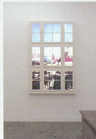
Von links: Objekte von Marjetica Potrc und Brian Tolle