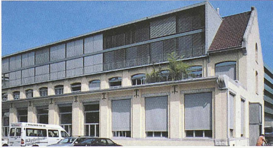
Die alte BBC-Modellbauschreinerei in Baden. Ein Haus mit neuem Geist. Und einem Steildach von ZZ Wancor.