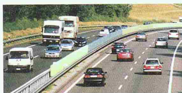
Beispiel A 1, St. Gallen – Gossau

Mobilität ist ein Grundbedürfnis von uns allen. Die unaufhaltsame Entwicklung ruft nach mehr Sicherheit und Komfort für Mensch und Natur. Wir wollen mithelfen, Flora und Fauna entlang den Verkehrswegen zu schonen, Personen bei der Benutzung von Strasse und Schiene zu schützen und die Immissionen entlang den Verkehrsachsen gering zu halten.