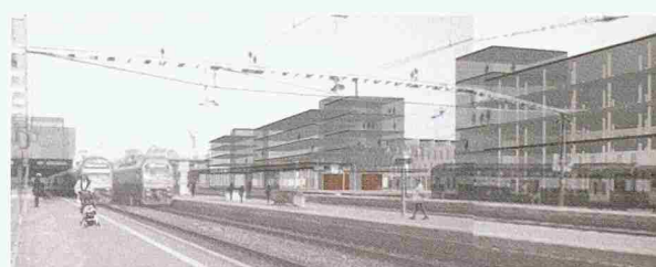
Der eher konventionelle Vorschlag des Berners Dieter Aeberhard erhielt für Illnau-Effretikon eine Anerkennung