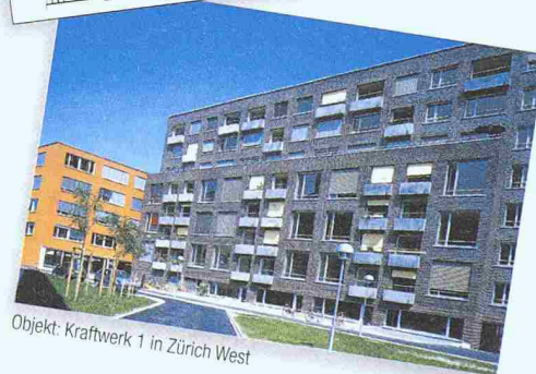
Objekt: Kraftwerk 1 in Zürich West