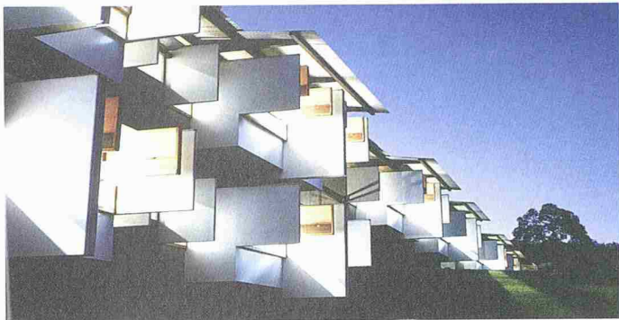
Fassade des Arthur & Yvonne Boyd Education Centre

(sda/op) Der australische Architekt Glenn Murcutt wird für sein Gesamtwerk mit dem Pritzker-Preis 2002 ausgezeichnet, der als «Nobelpreis der Architektur» gilt. Der nach der Chicagoer Hotelierfamilie Pritzker benannte Preis wird seit 1979 von der Hyatt-Stiftung verliehen und ist mit 100 000 Dollar notiert. Bisher bestätigte er nachträglich den Ruhm jener Vertreter der Architektenzunft, die in den westlichen Metropolen ein Grossprojekt nach dem anderen realisieren. So wurden letztes Jahr Jacques Herzog und Pierre de Meuron und im Jahr 2000 Rem Koolhaas gewürdigt.