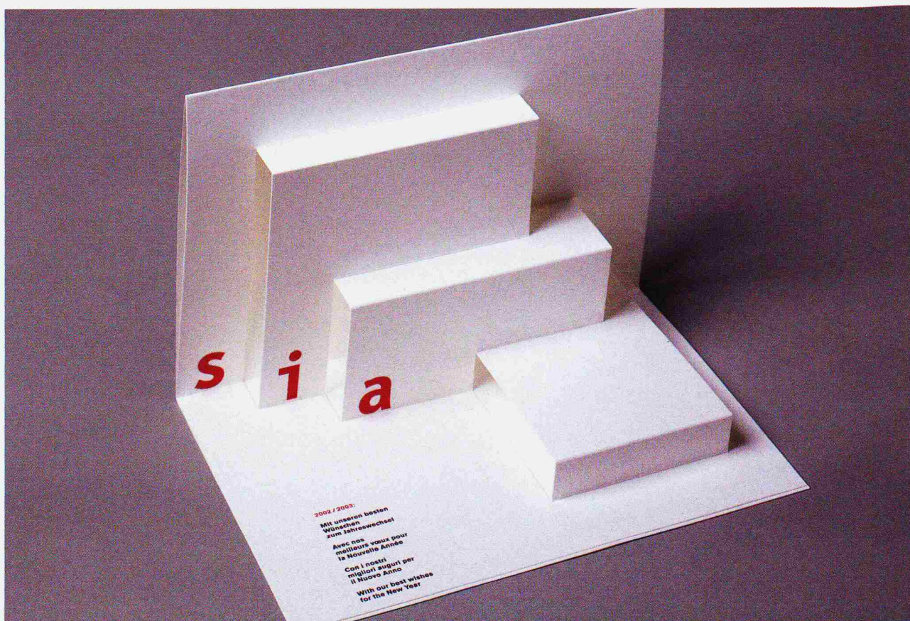
Von Jörg Hamburger gestaltetes Symbol zum Neujahr: Aus der gefalzten Karte öffnet sich ein dreidimensionales Volumen