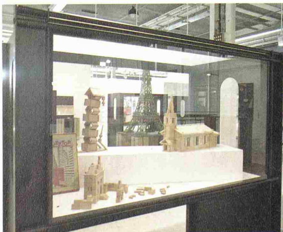
In jedem Baukasten steckt ein genialer Einfall

Nebst der Erarbeitung von Hilfsmitteln für die Planung, die Weiterbildung seiner Mitglieder und der Vertretung der Interessen nach aussen bietet der SIA seinen Mitgliedern als Abwechslung kulturelle Genüsse. An der Swissbau 02 zeigte er die Ausstellung «Konstruieren, eine Passion». Zahlreiche Besucher liessen es sich trotz ihres umfangreichen Programms nicht nehmen, in dieser Sonderausstellung längere Zeit zu verweilen. Manche vergassen die Zeit und die Umgebung beim Bau gewagter und kühner Objekte mit den bereitliegenden Kapla-Hölzchen. Die in den Vitrinen gezeigten Objekte liessen zahlreiche Erinnerungen an die Jugendzeit, an erste Erfolge und Misserfolge beim Bauen mit