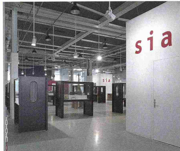
Der SIA zeigte seine Produkte und «Konstruieren, eine Passion». Partner waren die Zeitschriften tec21 und Tracés.

Holzklötzen und Konstruktionsspielen wieder aufleben. Der Umgang mit Bauklötzen, mit Meccano, Matador oder Lego weckte Fähigkeiten und prägte viele so nachhaltig, dass sie später Bauen zu ihrem Beruf machten. Die ausgestellten Spiele zeigen den erstaunlichen Einfallsreichtum ihrer Schöpfer und sind ein Spiegel der Technikgeschichte.