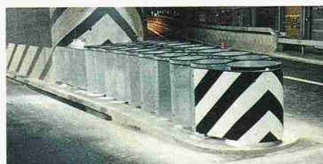
Beispiel A 2, Ausfahrt Luzern Zentrum

Mobilität ist ein Grundbedürfnis von uns allen. Die unaufhaltsame Entwicklung ruft nach mehr Sicherheit und Komfort für Mensch und Natur. Wir wollen mithelfen, Flora und Fauna entlang den Verkehrswegen zu schonen, Personen bei der Benutzung von Strasse und Schiene zu schützen und die Immissionen entlang den Verkehrsachsen gering zu halten.