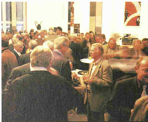
Ungezwungene Gespräche und reger Gedankenaustausch unter Gleichgesinnten

Gerade heute wo Politik, Wirtschaft und Gesellschaft über die einzuschlagenden Entwicklungspfade uneinig sind, braucht es einen starken Berufsverband: einen Berufsverband, der führend die nachhaltige Entwicklung im Umgang mit der Umwelt, der Wirtschaft und der Gesellschaft in Normen, Ordnungen und im Verhalten seiner Mitglieder gewährleistet, einen Berufsverband,