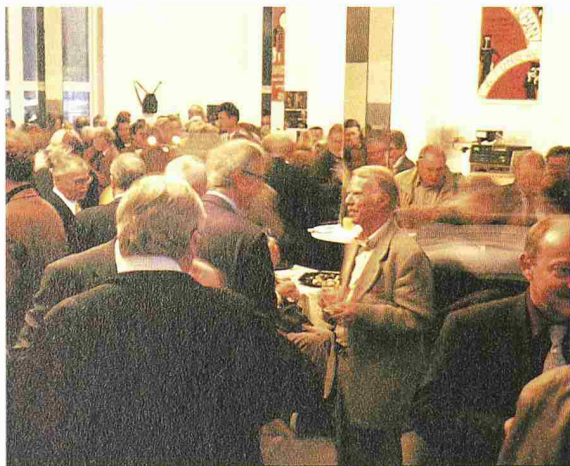
Ungezwungene Gespräche und reger Gedankenaustausch unter Gleichgesinnten

Gerade heute wo Politik, Wirtschaft und Gesellschaft über die einzuschlagenden Entwicklungspfade uneinig sind, braucht es einen starken Berufsverband: einen Berufsverband, der führend die nachhaltige Entwicklung im Umgang mit der Umwelt, der Wirtschaft und der Gesellschaft in Normen, Ordnungen und im Verhalten seiner Mitglieder gewährleistet, einen Berufsverband,