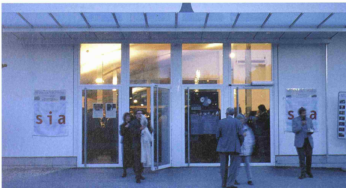
Festliche Atmosphäre im Mummenschanztheater auf der Arteplage in Biel

Mummenschanz, das sind vier Schauspielerinnen und Schauspieler, Pantomimen, Künstler. Im Hintergrund wirken Bühnentechnik und Administration. Diese Gruppe produziert Kunst – Ausdruck in Bewegung, Farbe, Form. Mummenschanz kann als bewundernswertes Netzwerk von Talenten gesehen werden. Es sind Ausnahmekönner, die sich als Gruppe verwirklichen. Die Mitglieder des SIA hingegen sind vor allem technisch orientierte Leute, planen und gestalten die Um- und Mitwelt. Sie dürfen und wollen sich mit Künstlern