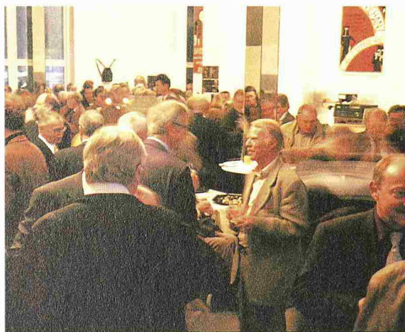
Ungezwungene Gespräche und reger Gedankenaustausch unter Gleichgesinnten

Gerade heute wo Politik, Wirtschaft und Gesellschaft über die einzuschlagenden Entwicklungspfade uneinig sind, braucht es einen starken Berufsverband: einen Berufsverband, der führend die nachhaltige Entwicklung im Umgang mit der Umwelt, der Wirtschaft und der Gesellschaft in Normen, Ordnungen und im Verhalten seiner Mitglieder gewährleistet, einen Berufsverband,