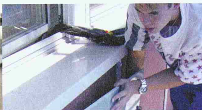
Schnelle Montage durch das einfache Einhängen der Glasplatten auf der Baustelle