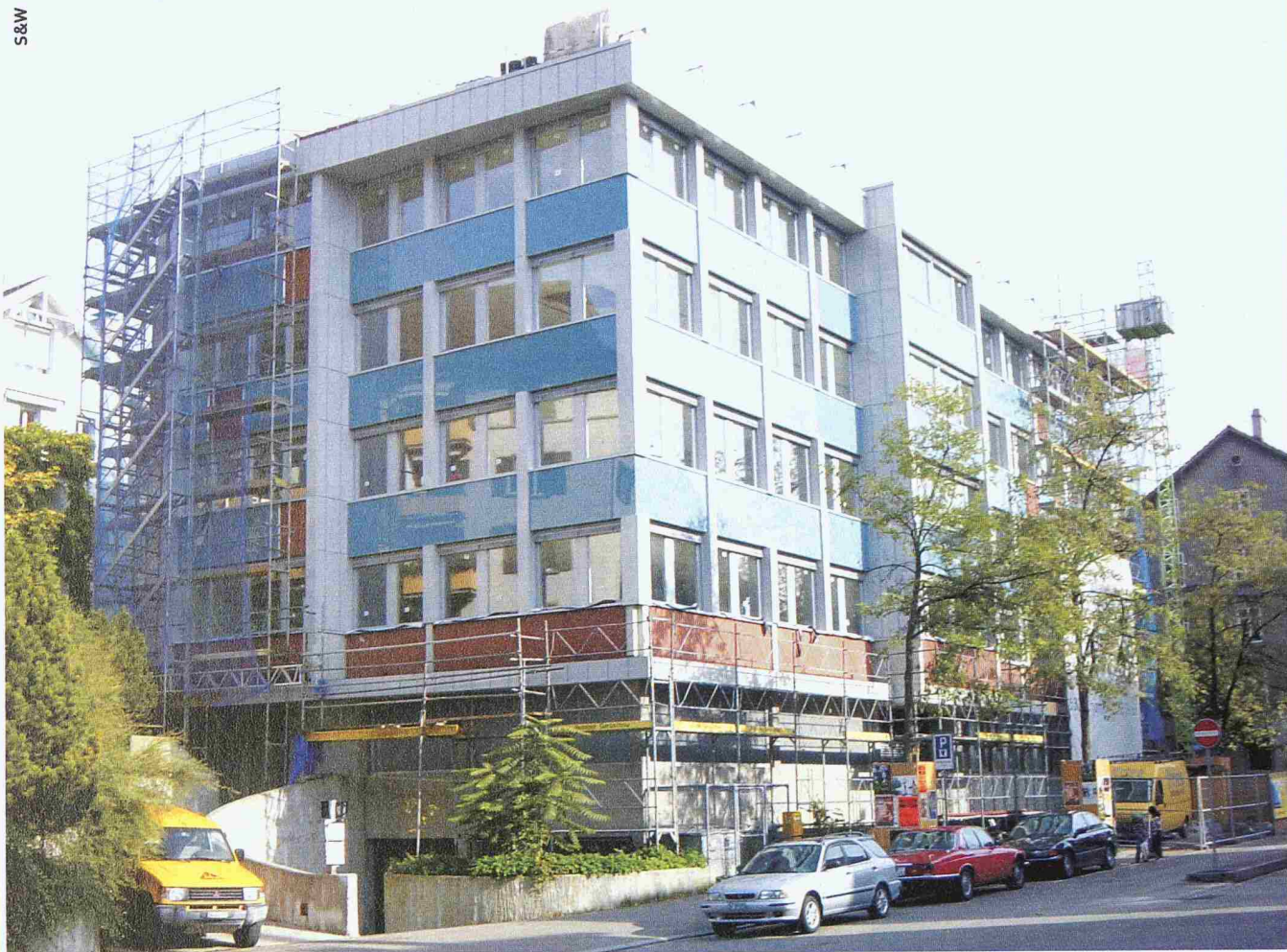
Geschäftshaus Höggerstrasse, Zürich