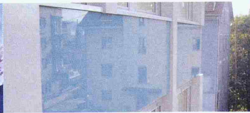
Raffinierte Optik, erzeugt durch die glatte, ästhetische Fassadenoberfläche

Verdeckte und wirtschaftliche Montage der Glas-Fassadenplatten durch Verkleben eines Einhängesystems in der Vorfabrikation mit SikaTack-Panel.