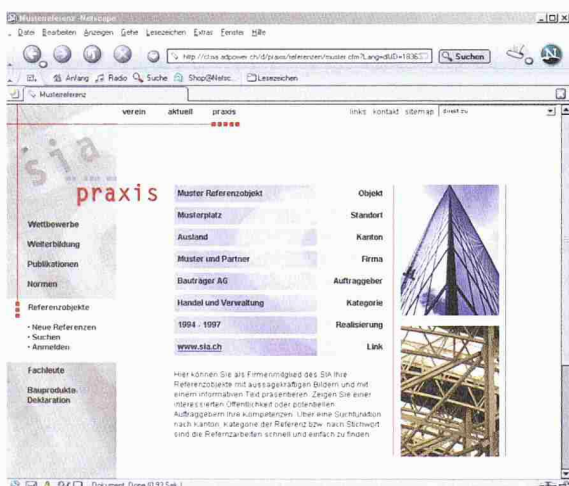
Die Homepage zeigt Referenzobjekte von Firmenmitgliedern

Das umfangreiche Verlagsprogramm des SIA umfasst nebst dem Normenwerk Vertragsformulare, Dokumentationen, Sonderpublikationen, Fachliteratur und Verinsschriften. Die Publikationen können über das Internet bestellt werden. Eine komfortable Suchfunktion