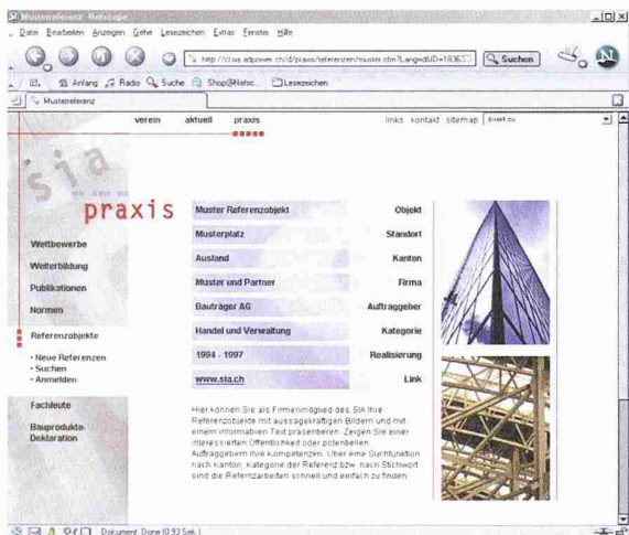
Die Homepage zeigt Referenzobjekte von Firmenmitgliedern

Das umfangreiche Verlagsprogramm des SIA umfasst nebst dem Normenwerk Vertragsformulare, Dokumentationen, Sonderpublikationen, Fachliteratur und Verreinschriften. Die Publikationen können über das Internet bestellt werden. Eine komfortable Suchfunktion