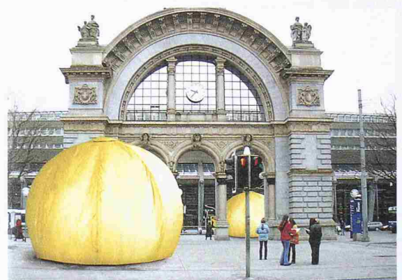
Modell eines «Chat-Bubble»

begeh- und erlebbare Wohnvisionen der Zukunft. Ziel der interaktiven und auch als Bühne für Live-Aktionen dienenden Rauminstallationen ist es, das Publikum für neue Wohnformen zu sensibilisieren und die persönliche Lebensqualität durch das Interesse für das Thema Wohnen zu steigern. Bestaunt werden können beispielsweise 6 m hohe «Bubbles», Kunststoff-Konstruktionen, die als Ruhezone (blau) oder als Kommunikationsorte (gelb) dienen sollen. Das Konzept der Ausstellung stammt von der Hochschule für Gestaltung und Kunst Luzern und der Hochschule für Technik und Architektur Horw.