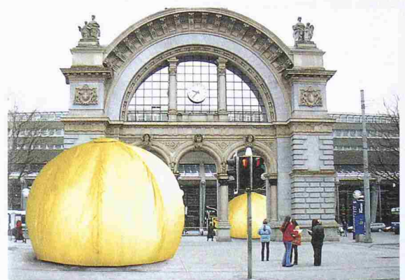
Modell eines «Chat-Bubble» (Bild: Spielraum – Stiftung Wohnkultur; Fotomontage)

begeh- und erlebbare Wohnvisionen der Zukunft. Ziel der interaktiven und auch als Bühne für Live-Aktionen dienenden Rauminstallationen ist es, das Publikum für neue Wohnformen zu sensibilisieren und die persönliche Lebensqualität durch das Interesse für das Thema Wohnen zu steigern. Bestaunt werden können beispielsweise 6 m hohe «Bubbles», Kunststoff-Konstruktionen, die als Ruhezone (blau) oder als Kommunikationsorte (gelb) dienen sollen. Das Konzept der Ausstellung stammt von der Hochschule für Gestaltung und Kunst Luzern und der Hochschule für Technik und Architektur Horw.