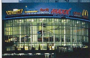
MaXX Filmpalast Emmenbrücke

Dahinter steckt unsere Liebe zur Präzision.