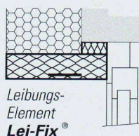
Leibungs- Element Lei-Fix®

Ausschreibungstexte für Elemente zu Wärmedämm- systemen nach NPK 3,5"-Diskette, PC-formatiert, für Schnittstelle SIA 451