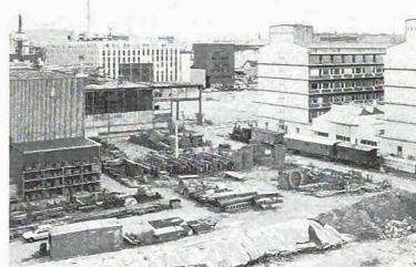
Lauf der Zeit: vom Agrargebiet übers Industrie- zum gemischten Stadtquartier