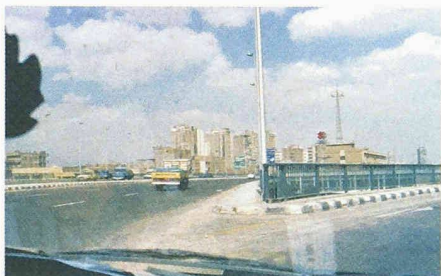
Schnittstelle zwischen Innen und Aussen

Balkon und Terrasse, Baldachin und Pergola, Gartenlaube und Zelt bilden die Vorlagen und Sinnbilder, die Rüegg und Bachmann in Zeichnungen, installati-