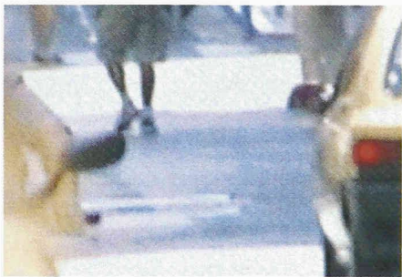
Poetische Atmosphäre im urbanen Gefüge

Patchwork-Landschaften ohne Bestand, Städte, die in unserer Vorstellung zerfliessen: Mit ihrer gemeinsamen Arbeit thematisieren Corina Rüegg und Ursula Bachman diese «Zwischenstädte», die lebensräumlichen Spannungsbereiche zwischen Innen und Aussen in den ausufernden Zwischenzonen heutiger Metropolen.