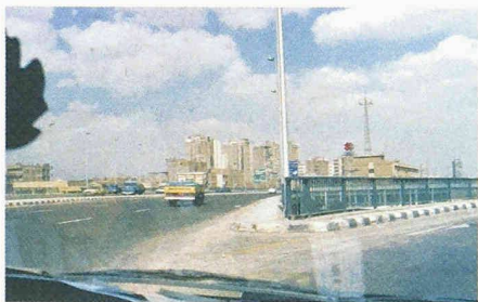
Schnittstelle zwischen Innen und Aussen

Balkon und Terrasse, Baldachin und Pergola, Gartenlaube und Zelt bilden die Vorlagen und Sinnbilder, die Rüegg und Bachmann in Zeichnungen, installati-