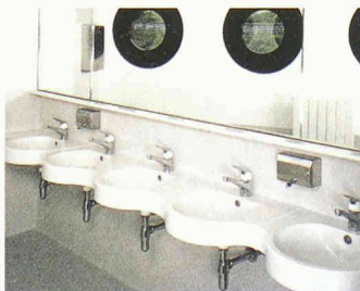
Waschtisch der Romay AG mit integrierter Ablage und Rückwand

Romay präsentiert Gesamtlösungen für Waschtische und Waschplätze im öffentlichen und halb-öffentlichen Bereich, wie öffentliche Toiletten, Sanitäranlagen in Verwaltungsgebäuden, in der Gastronomie, im Gewerbe, Heimen und Sportzentren. Die Waschtische Marello mit integrierter Ablage sind mit 1, 2, 3 oder 4 Becken erhältlich. Die Ablagemöglichkeiten können auf die individuellen baulichen Situationen abgestimmt werden. Die Waschtische Marello sind mit Verbindungsstücken erweiterbar, wie