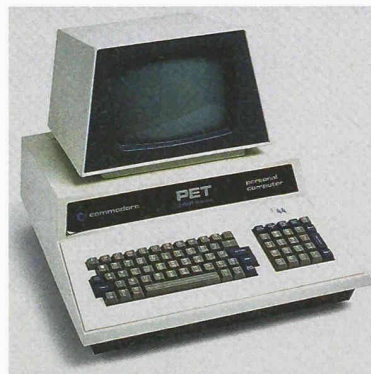
Bild links: Screenshot aus «Micromachines» für Amiga. An der Ausstellung können die beliebtesten Games wie «Gremlins» oder «Frogger» gespielt werden. Marken wie Commodore (Bild rechts Modell Pet, 1978), Atari und Sinclair wurden verdrängt durch den Standard der IBM-kompatiblen PC.