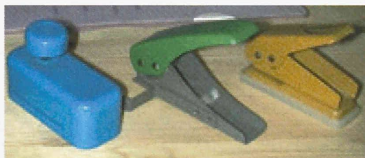
Locher für 5 1/4-Zoll-Disketten