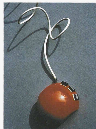
Erste europäische Computermouse (1982), entwickelt 1979 an der EPFL

Museum für Kommunikation, Helvetiastrasse 16, 3000 Bern 6. Tel. 031 357 55 11, www.mfk.ch Öffnungszeiten Di bis So 10 bis 17 Uhr Die Sonderausstellung Control-Alt-Collect dauert bis mindestens Ende Jahr.