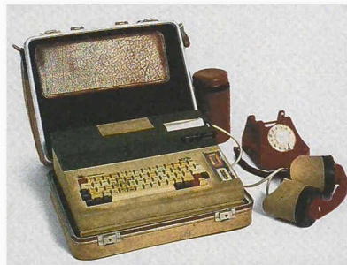
Portabler Journalistencomputer «Scrib» (EPFL 1977) mit Akustikkoppler