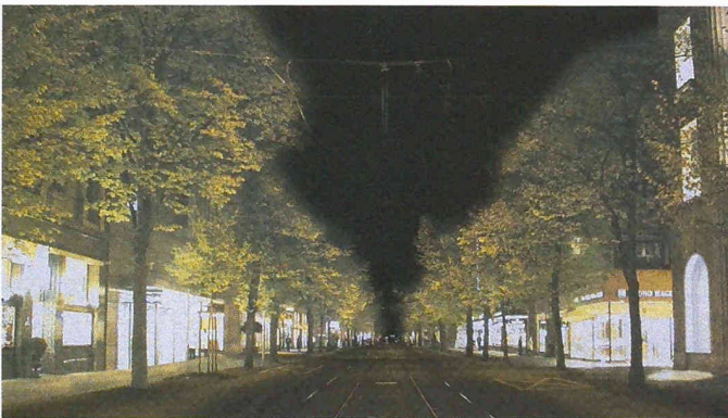
Bereich Bahnhofstrasse: zur Weiterbearbeitung empfohlener Vorschlag des Teams Fries und Huggen_berger aus Zürich