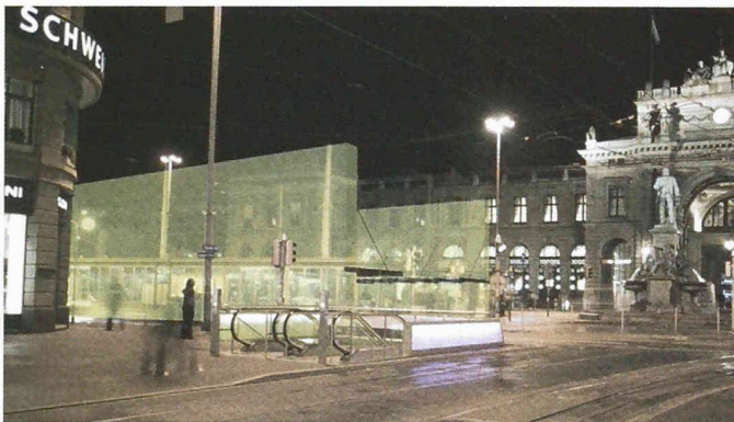
Tramhaltestelle Bahnhofplatz: zur Weiterbearbeitung empfohlener Vorschlag des Teams Rämi und Dürig aus Zürich