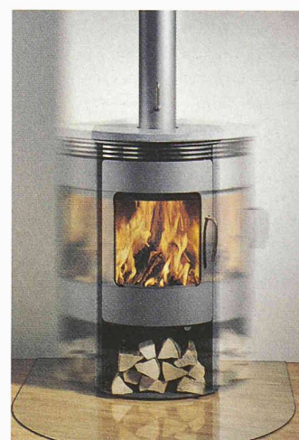
Der drehbare Cheminéeofen Gabo der Attika Feuer AG

Attika Feuer AG 6312 Steinhausen 041 749 99 99 www.attika.ch Halle 3.U, Stand E 44