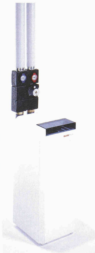
Die Elcoplus Erdsonden-Wasser-Wasser Wärmepumpe Aquatop von Elcotherm mit einer Heizleistung von 5–22 kW

Elcotherm AG 8810 Horgen 01 727 91 91 www.elcotherm.ch Halle 3.0, Stand E 10