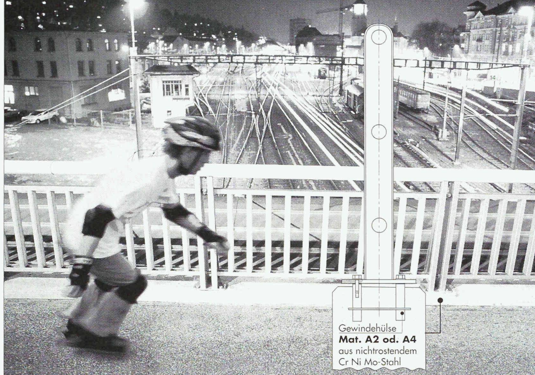
Gewindehülse Mat. A2 od. A4 aus nichtrostendem Cr Ni Mo-Stahl