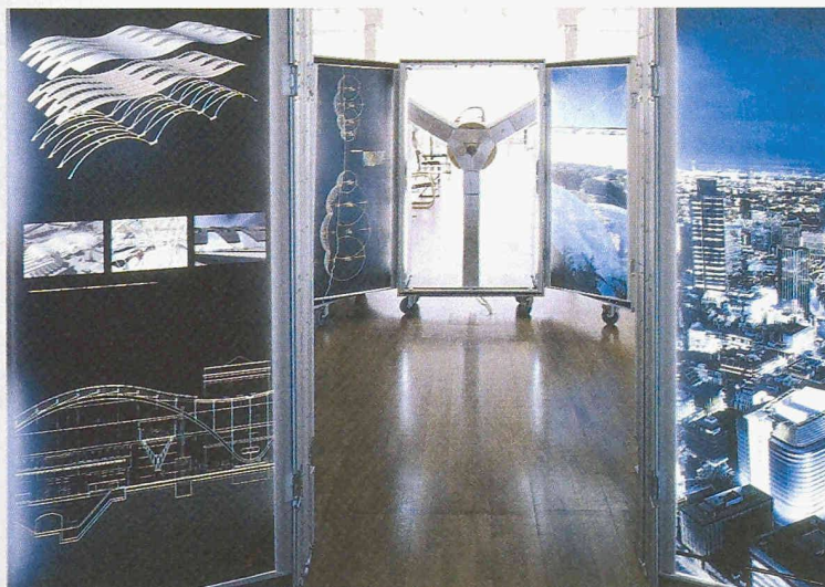
Die Ausstellung «Equilibrium» über die neusten Arbeiten von Nicholas Grimshaw & Partners besteht aus einer Serie von Aluminium-Schaukästen. Dank einem Mix aus computergenerierten Video-Installationen, Fotografien und Modellen präsentiert sich jedes Objekt als ein offenes virtuelles Haus. Neben bereits gebauten Projekten werden verschiedene Wettbewerbe und Projekte im Bau wie der Flughafenkopf Zürich gezeigt. Das «Eden Project» in Cornwall kann ebenfalls bis ins Detail betrachtet werden