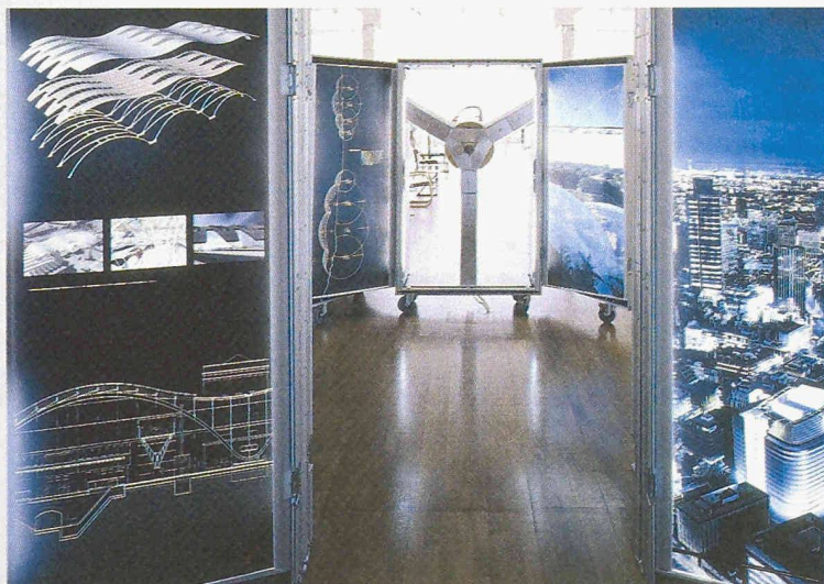
Die Ausstellung «Equilibrium» über die neusten Arbeiten von Nicholas Grimshaw & Partners besteht aus einer Serie von Aluminium-Schaukästen. Dank einem Mix aus computergenerierten Video-Installationen, Fotografien und Modellen präsentiert sich jedes Objekt als ein offenes virtuelles Haus. Neben bereits gebauten Projekten werden verschiedene Wettbewerbe und Projekte im Bau wie der Flughafenkopf Zürich gezeigt. Das «Eden Project» in Cornwall kann ebenfalls bis ins Detail betrachtet werden