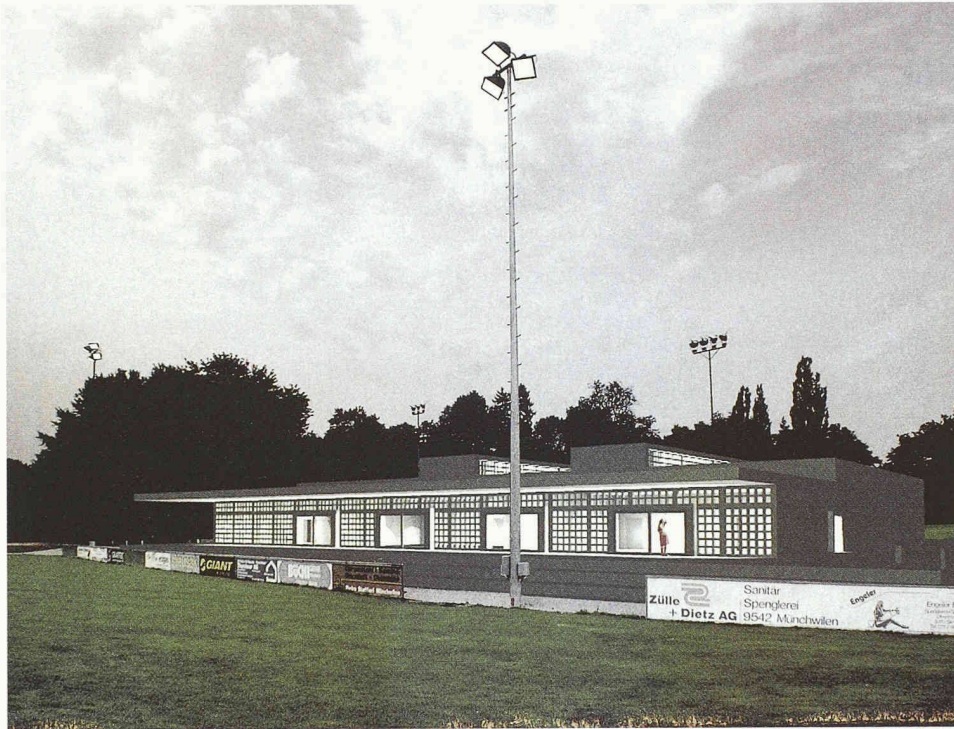
Sporthalle Waldegg, Münchwilen: im Rahmen der Weiterbildung zur Ausführung empfohlenes Projekt von Roger Boltshauser