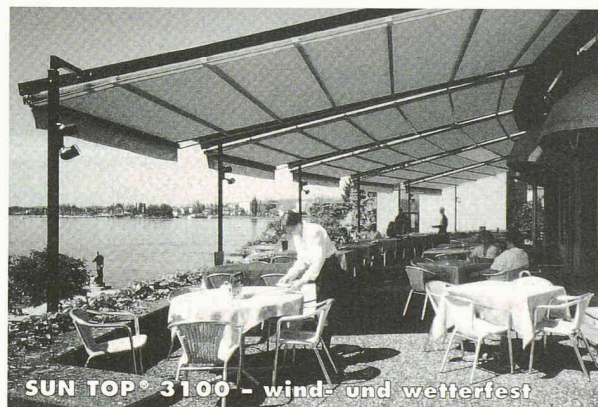
SUN TOP® 3100 - wind- und wetterfest

LIEBER EIN KÜHLES BIER IM SCHATTEN ALS GEBRATEN AN DER SONNE