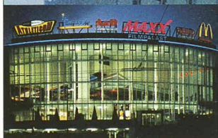
➔ MaXX Filmpalast Emmenbrücke

Dahinter steckt unsere Liebe zur Präzision.