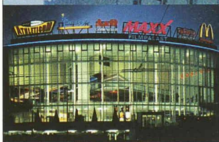
➔ MaXX Filmpalast Emmenbrücke

Dahinter steckt unsere Liebe zur Präzision.