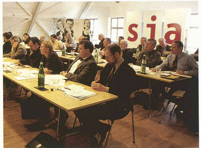
Delegierte SIA im Design Center Langenthal

Das Budget des SIA für das Jahr 2001 war an sich nicht bestritten. Hingegen gab der Antrag aus der Sektion Zürich zu reden, welcher verlangt, dass jene Einzelmitglieder, die älter als 65 Jahre sind, vom Jahresbeitrag befreit werden sollen. Sie hätten aber einen Anteil von 90 Franken an das Abonnement der Zeitschrift tec21 zu bezahlen, sofern sie diese weiterhin zu erhalten wünschen. Wer will, kann gemäss diesem Antrag weiterhin Einzelmitglied bleiben und damit weiter alle Leistungen beziehen. Dieser Antrag wurde durch die Versammlung gutgeheissen. Knapp verworfen hingegen wurde ein Antrag aus der Sektion Innerschweiz, den Jahresbeitrag für die neu geschaffene Partnermitgliedschaft von 500 auf 1000 Franken zu erhöhen. Zudem wurde verlangt, genügend Mittel für korrekte Übersetzungen in die französische Sprache einzusetzen. Letzteres ist – wie Erfahrungen zeigen – weniger eine Frage des Budgets als vielmehr der Qualitätssicherung. Deshalb wird sich eine Arbeitsgruppe des Problems annehmen. Insgesamt wurde das Budget einstimmig gutgeheissen.