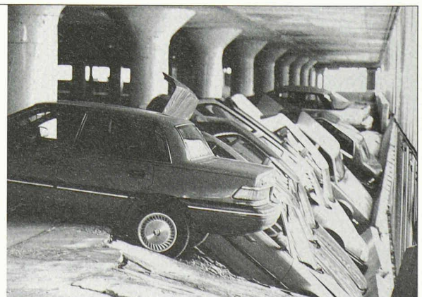
Durch Korrosion zerstörte Bewehrung

Telefax 01-980 29 93 e-mail info@baueringenieure.ch www.baueringenieure.ch