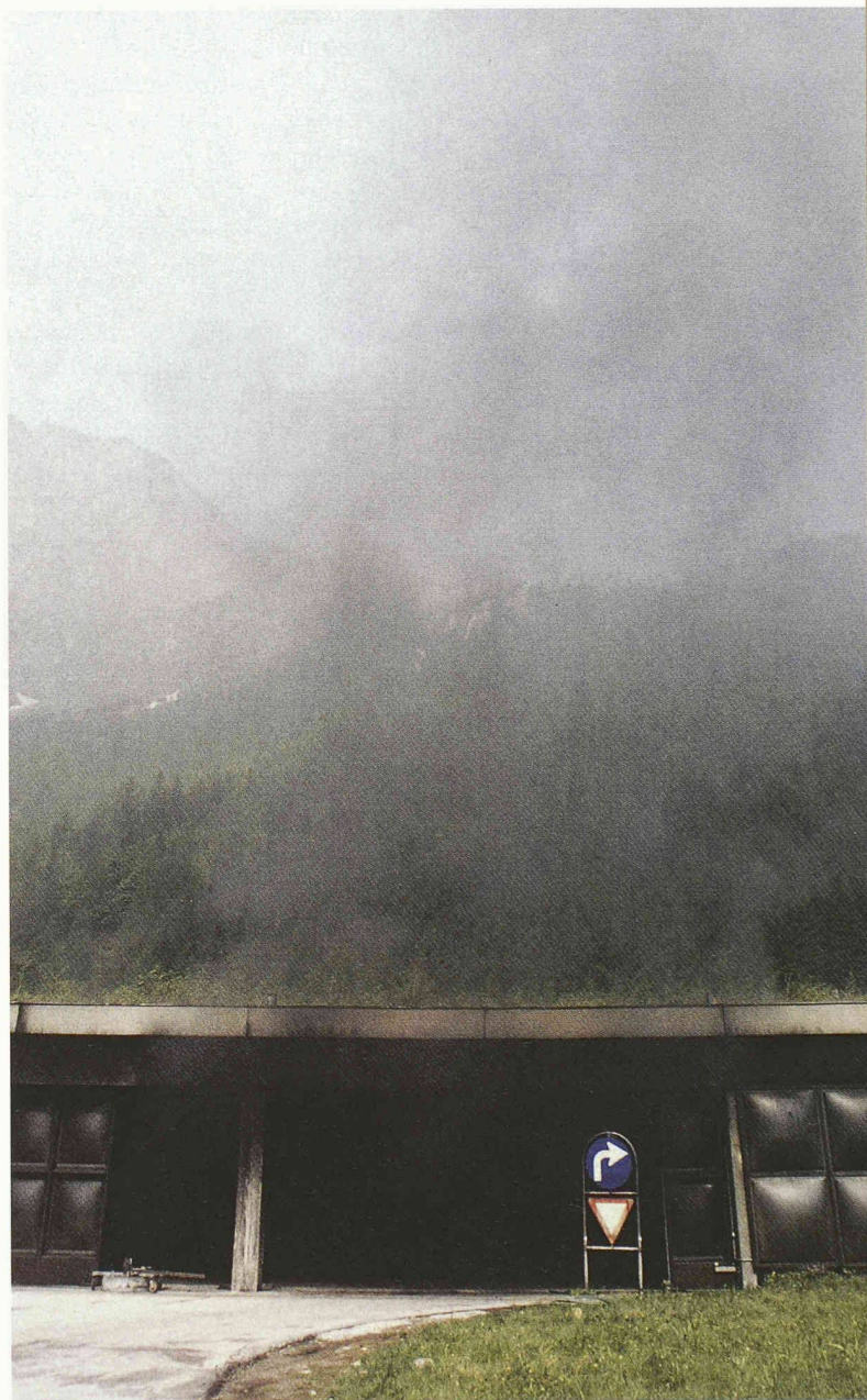
Tauern-tunnel am 29. 5. 1999

Die Brandkatastrophe im Strassentunnel unter dem Montblanc im März 1999 mit 39 Todesopfern zeigte