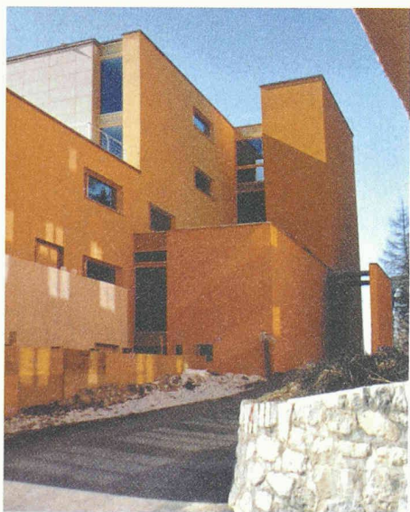
Die Schutzscheibe vor dem Eingang wird Element des Gesamtkonzeptes, Lyceum Alpinum Zuoz (Architekt: Andres Carosio)