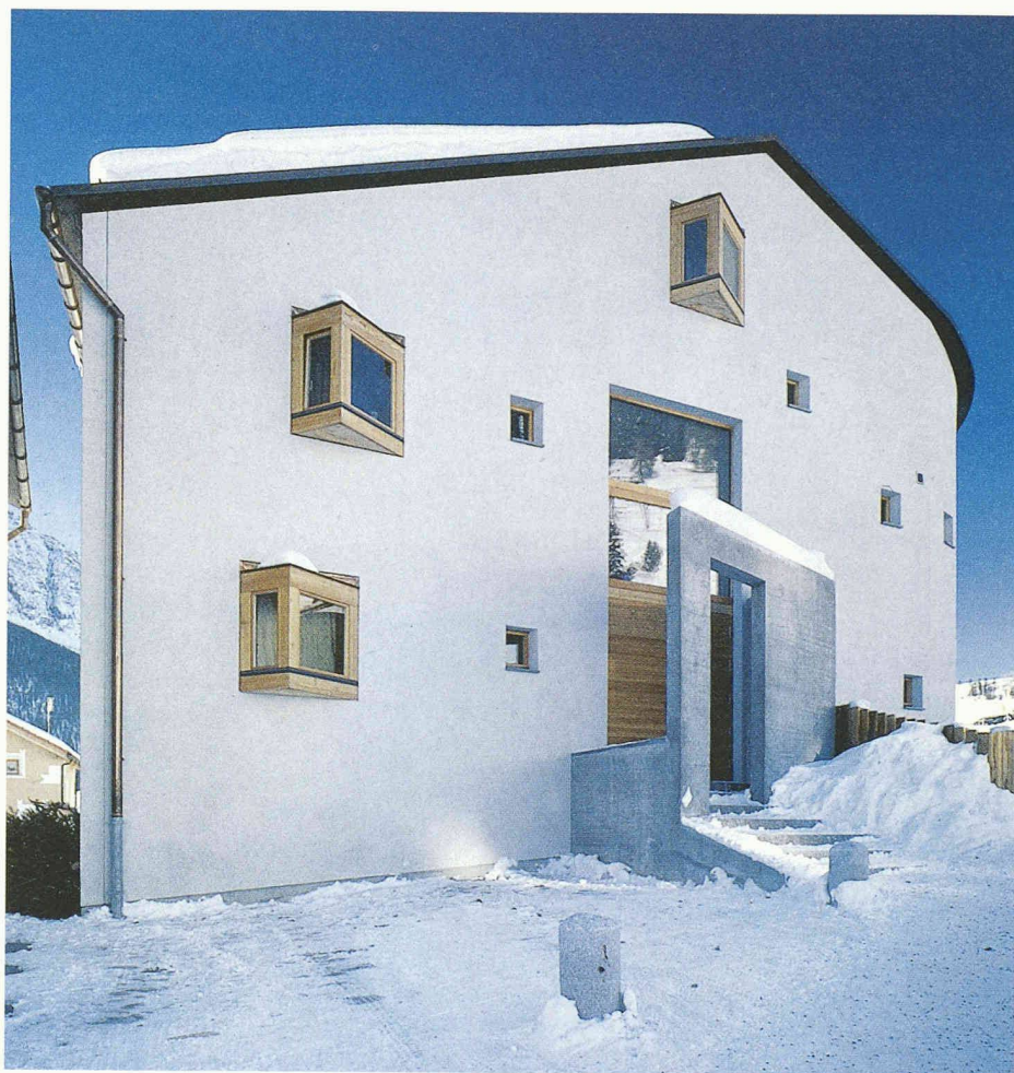
Erker und Tor als gestalterische Reaktion auf den Zwang zum Schutz, Mehrfamilienhaus, Zuoz (Pfister Schiess Tropeano und Partner AG)

einem seitlich offenen Vorbau in Beton geschützt. Vor die alten Fensteröffnungen im Erdgeschoss wurden in einem Abstand von 10 cm Scheiben montiert, so dass die Fenster trotzdem weiterhin zu öffnen sind. Bei einer Breite von 138 cm und einer Höhe von 286 cm waren Panzergläser von 20 mm Dicke erforderlich. Beim Ergänzungsbau für das Lyceum Alpinum in Zuoz hat Architekt Andres Carosio ein gestalterisches Prinzip gewählt, das ihm erlaubt, die schützende Scheibe vor dem hangseitigen Eingang zum ersten Element einer Schichtung von Mauerscheiben und schmalen Baukörpern zu machen. Scheibe und Baukörper sind aus verputztem Stahlbeton erstellt. Es entsteht ein Gesamteindruck, der die erzwungene Zusatzmassnahme zum integrierten Teil des Konzeptes werden lässt.