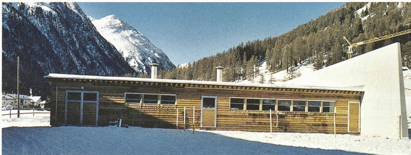
Unverhüllte Tatsachen: Schutzmauer eines Stalles in Bever (Architekt: Buolf Vital)

Beim Umbau des ehemaligen Hotels Rosegg in Pontresina zu einem Mehrfamilienhaus (Architekturbüro Hans Hirschi AG) erforderten die Vorschriften der Gebäudeversicherung Vorkehrungen für die Eingangstür und die Fenster im Erdgeschoss. Die Türe wurde mit