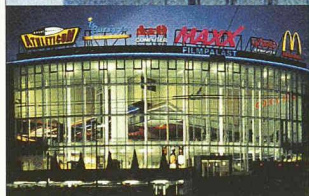
MaXX Filmpalast Emmenbrücke

Dahinter steckt unsere Liebe zur Präzision.