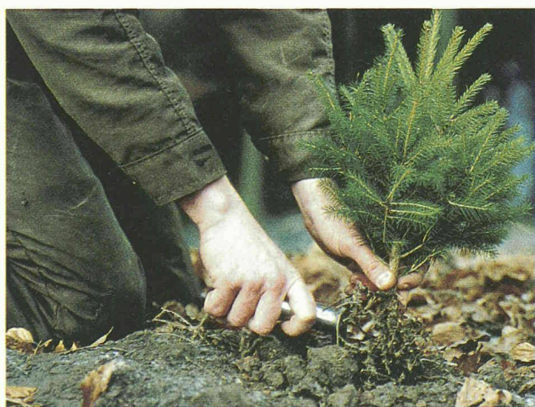
Fortbildung im Wald – Teil nachhaltigen Handelns