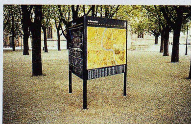
In Basel wurde 1980 das erste stadtübergreifende Informationssystem für Fussgänger eingerichtet (Bild: Hauptorientierung Münsterplatz)

19.12., 17–19 h, im Auditorium Hotel Hilton, Basel; Tel. 031 990 32 32 (HGKK)