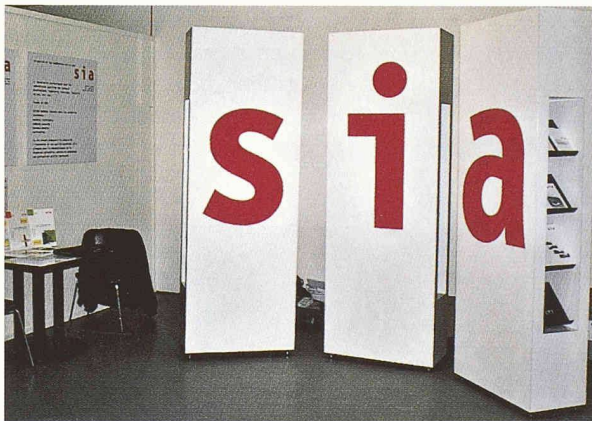
Der SIA zeigte an der Hausbau- und Minergiemesse seine Drucksachen und Dienstleistungen