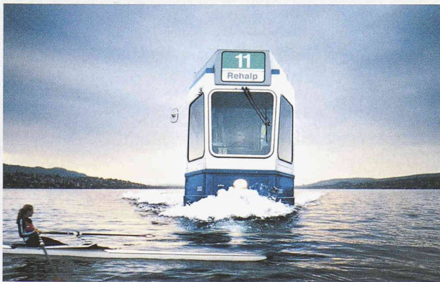
Der Zürcher Verkehrsverbund / Kat. Service Design