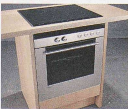
HE 37.054 – Einbauherd / Kat. Industrial Design