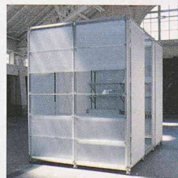
Constructiv Pila Office von B. Leitner / Kat. Industrial Design