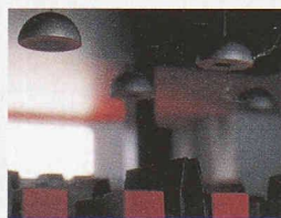
Public Spaces (Stimmungen im Raum) / Kat. WG Industrie Design