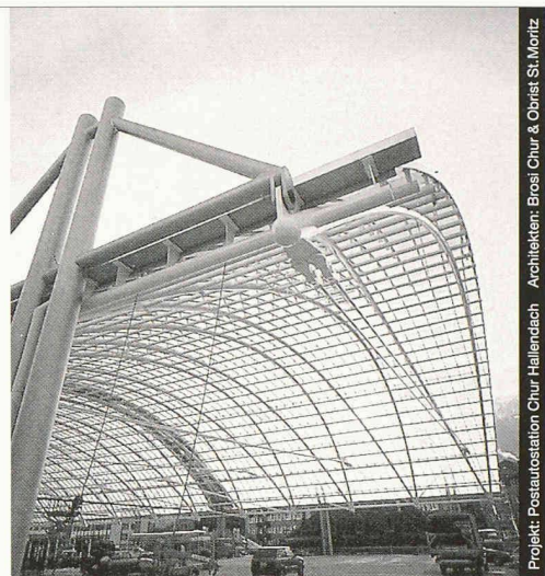
Projekt: Postautostation Chur Hallendach Architekten: Brösli Chur & Obrist St. Moritz

Stahl-Glas-Konstruktionen in architektonisch perfekter Vollendung verwirklichen wir mit innovativen Ideen und höchsten Anforderungen an Materialien und Ausführung.