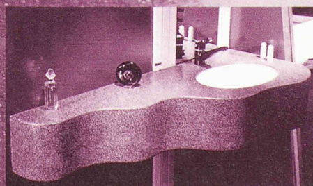
für Individual- lösungen von Grossabnehmern