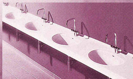
im Sanitärbereich öffentlicher Bauten

VARI-COR® lässt anspruchsvolle Innenraumgestaltung leben. Ein vielseitiger High Tech Mineralwerkstoff für exklusive, hochwertige, moderne und farbenprächtige Lösungen. Flexibel in der Planung. Einfach in der Verarbeitung. Praktisch im täglichen Gebrauch. VARI-COR® findet in den verschiedensten Segmenten Anwendung, z.B.