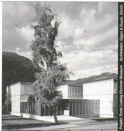
Projekt: Ernst Ludwig Kirchner Museum Architekten: Gijon & Guyer, Zürich

Ästhetik, Wirtschaftlichkeit und bauphysikalische Anforderungen in Einklang zu bringen, ist das Ergebnis ausgereifter Konstruktionen. Qualitätsbewusstsein und partnerschaftliche Zusammenarbeit sind nur einige der Voraussetzungen für ein gutes Gelingen in dieser vielfältigen Branche.