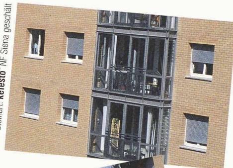
Steinart: kelesto ® NF Siena geschliff