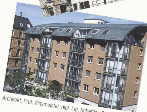
Architekt: Prof. Zinsmeister, dipl. Ing. Scheffler, Stuttgart

Das Prädikat wertvoll für Objekt und Material. Die kelesto ®-Linie der Keller AG Ziegeleien für innovative Architektur in Sichtstein und Klinker.