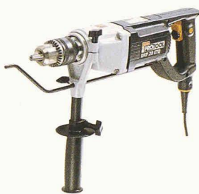
Die neue Bohrmaschine DRP 20 ETQ mit einem Drehmoment von 93 Nm

Meyer Befestigungen, Hammerstr. 1, Postfach, 4410 Liestal, Tel. 061 901 66 00, Fax 061 901 66 01, E-Mail: info@meyerbef.ch