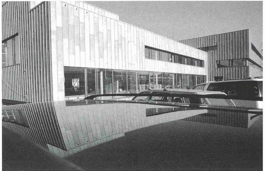
Bei den Erweiterungsbauten des Eidgenössischen Amtes für Messwesen in Wabern wurde eine Filterschicht aus Eisenhydroxid und Kalksand eingebaut, um das von den Fassaden abtropfende Kupfer zu binden