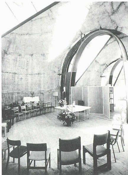
Aus drei Raumkörpern besteht die unvollendete Kirche Cazis, die je nach Bedarf einzeln benützt werden können (Architekt: Werner Schmidt, Trun)

(pd) Was auf den ersten Blick wie unförmige Betonhüllen aussieht, entpuppt sich bei näherem Hinsehen als avantgardistischer Kirchenbau. Drei Steine sollen die drei Gebäudeteile der Kirche Cazis symbolisieren. «Grosse Steine üben auf Kinder eine eigenartige Anziehungskraft aus. Unsere Vorfahren trafen sich an solchen Orten, um Versammlungen abzuhalten.» Mit diesem Gedanken hatte der Architekt Werner Schmidt die evangelisch-reformierte Kirchgemeinde von seinem Projekt überzeugt. Mit nur 430 Mitgliedern muss sie für den Bau rund zwei Millionen Franken aufbringen. Da es zu Kostenüberschreitungen kam, wurde vorerst ein Baustopp verfügt. Um die Kirche trotzdem benutzen zu können, musste improvisiert werden – für die Bestuhlung z.B. fand man alte, auf Estrichen herumstehende Stühle.