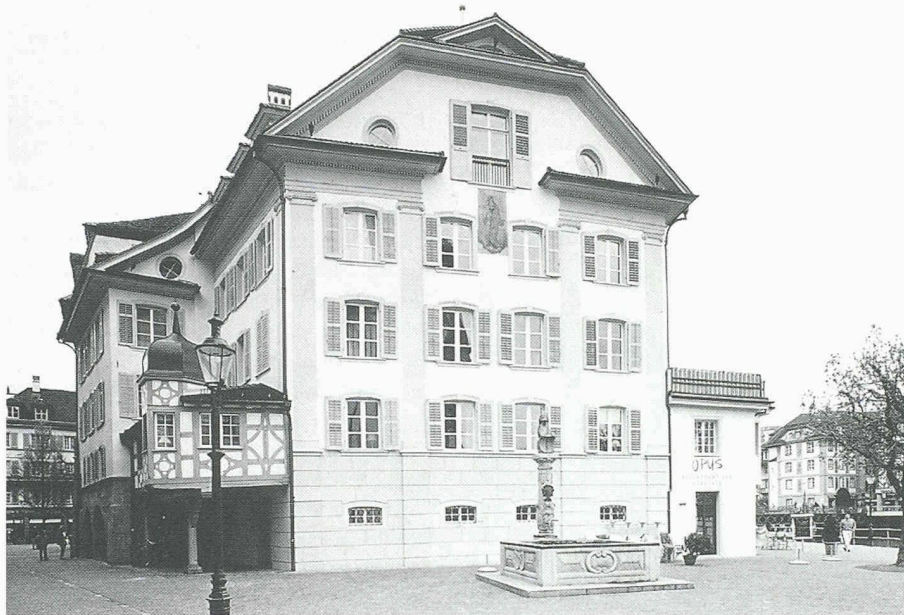
Der Staat Luzern erhielt die Auszeichnung «Goldenes Dach» für die Renovation einer Gebäudegruppe an der Luzerner Bahnhofstrasse. Im Bild das Mettenwylhaus