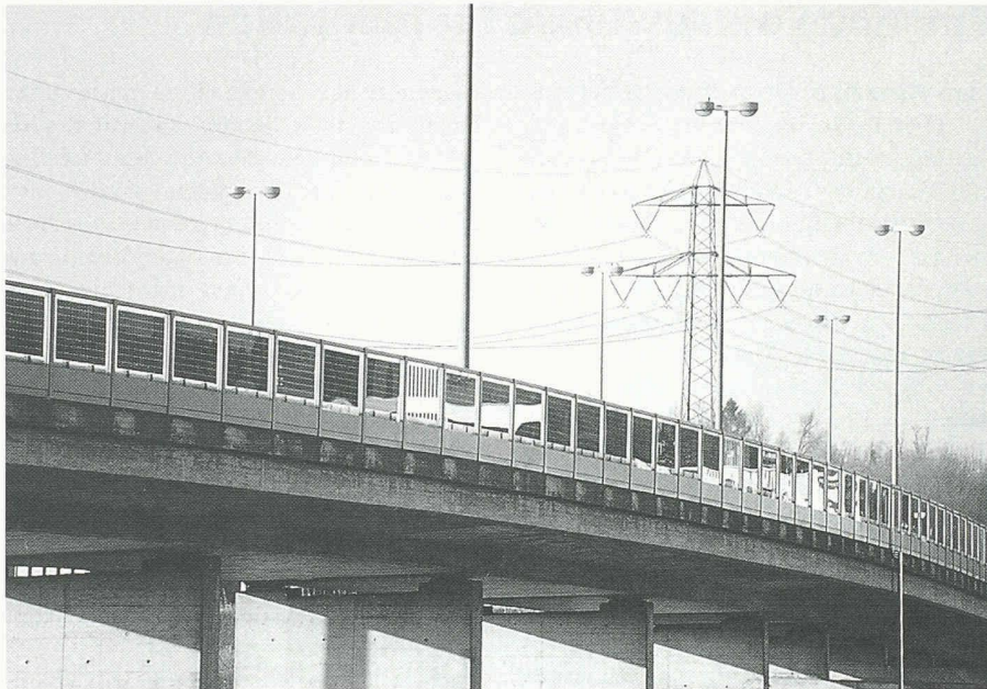
An der A1 in Wallisellen wurde eine Photovoltaikanlage in eine Lärmschutzwand integriert