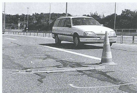
Schweizer Strassen werden wegen überall gekürzter Mittel nicht mehr in erforderlichem Masse unterhalten