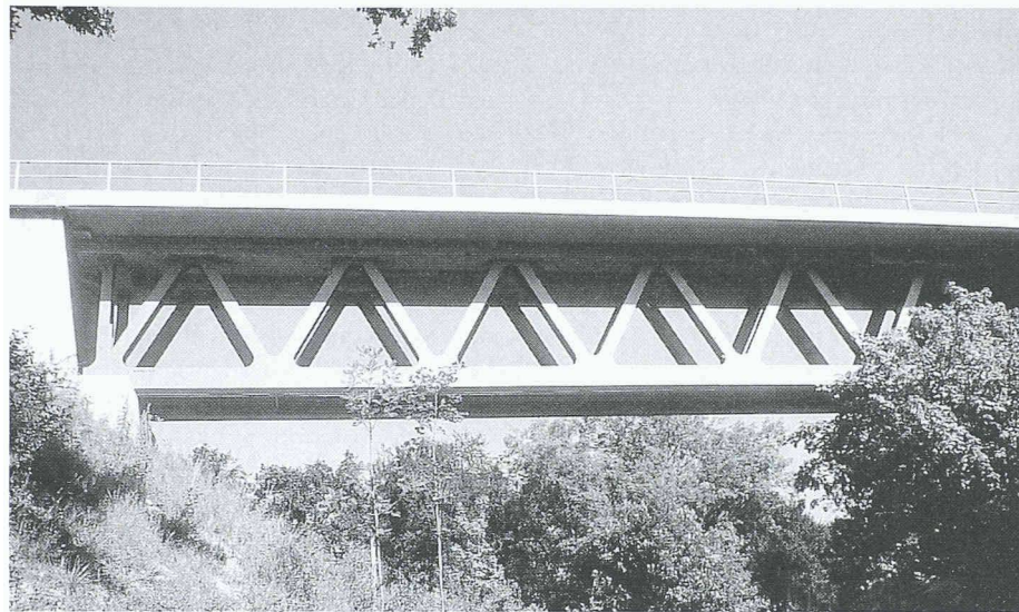
Eisenbahn-Fachverbundbrücke bei Wasserburg (Südbayern)