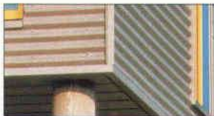
Ausführung in QUARTZ-ZINC

Bei VM ZINC können Sie unter Blechen und Bändern in unterschiedlichen Standardstärken und