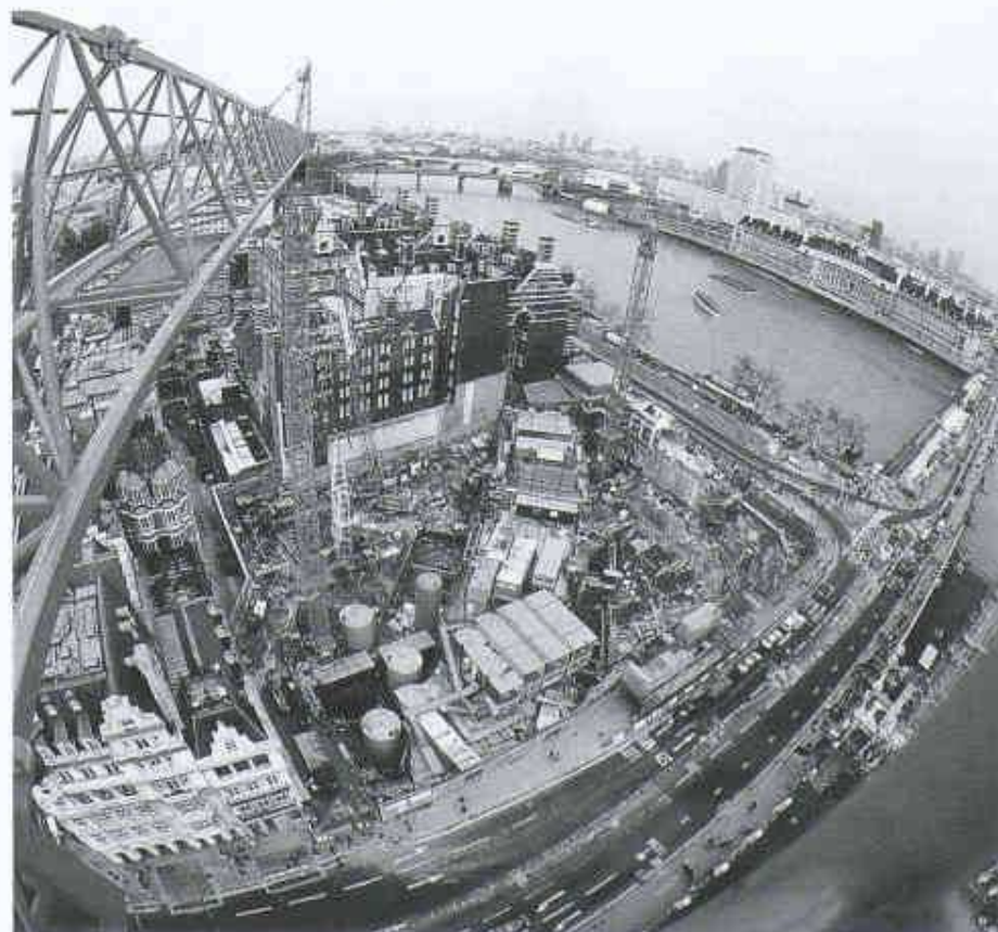
Die Aufnahme zeigt die Station Westminister gegenüber dem Parlamentsgebäude. Von hier

Der Bau der Station Canary Wharf, die den Canary Wharf Tower sowie die Umgebung der sanierten Docklands bedient, befindet sich an einem der wiederbelebten Docks. Nach der Fertigstellung wird das Dach zwischen den Oberlichtern der Station begrünt und als Park gestaltet.