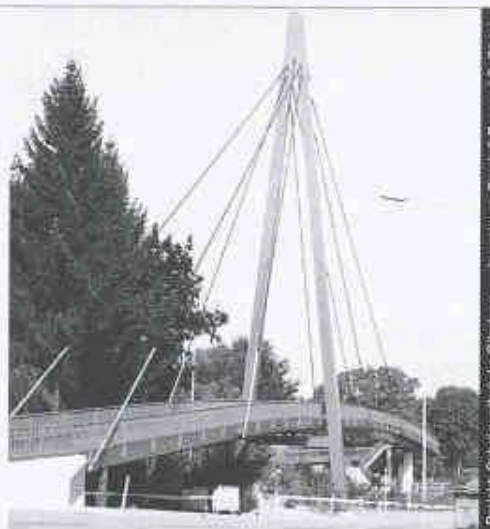
Projekt: Schrägseilbrücke Rülmating Ingenieurbüro: Ernst & Berger AG, Zürich

Nur mit diesem Baustoff sind die grössten Spannweiten und Höhen möglich, dies mit Berücksichtigung der Wirtschaftlichkeit und des vorteilhaften Leistungsgewichtes. Stahl bietet eine nahezu unerschöpfliche Fülle von Möglichkeiten, Ihre Ideen zu verwirklichen.